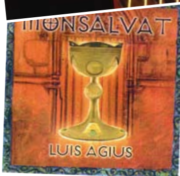
Cartel de Monsalvat, ópera en tres actos (2005)