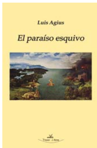
Portada de la obra El Paraíso Esquivo (2019). Visión Libros.