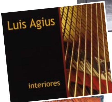
Portada del disco Interiores, publicado en el año 2000