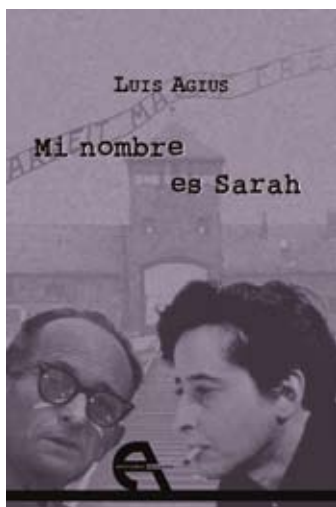
Portada de la obra Mi nombre es Sarah (2013). Ediciones Antígona.