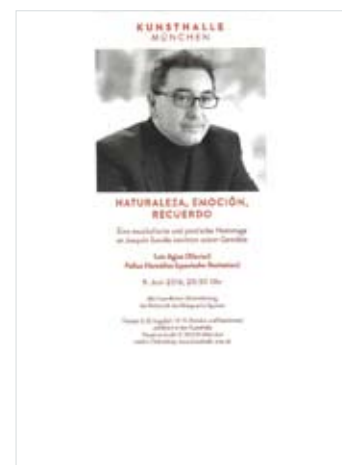
Cartel del recital de Luis Agius en el Museo Kunsthalle (Munich, 2016).