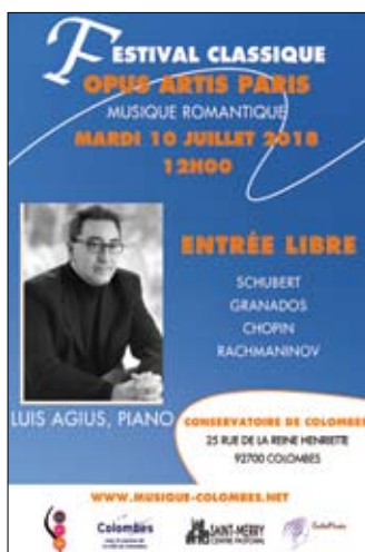
Cartel del recital de Luis Agius en el Festival de Colombes (París, 2018).