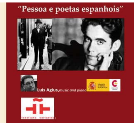
Cartel de la representación de la obra Mi nombre es Sarah en la Sala Berlanga (2015).