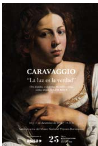
Cartel de la obra de Caravaggio, representada en el Museo Thyssen en 2018.