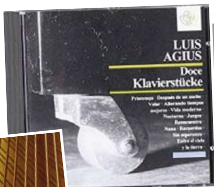
Portada del disco Doce Klavierstücke, publicado en 1994