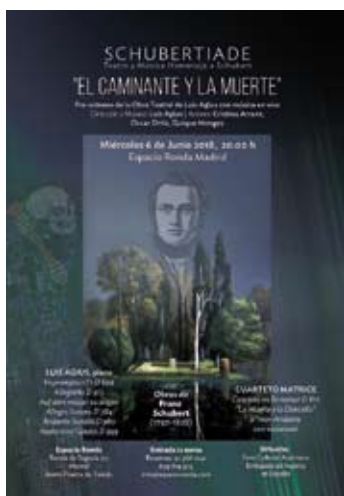
Cartel del estreno El caminante y la muerte (Espacio Ronda, 2018).